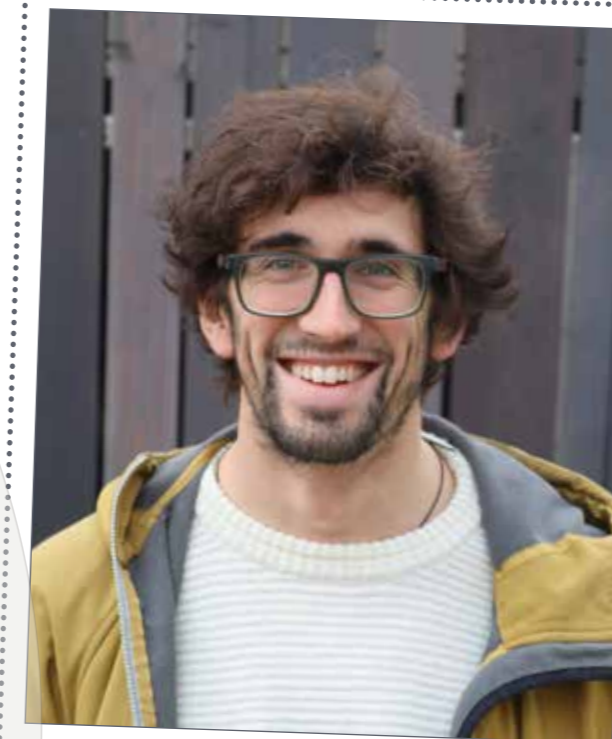
JOE PREMIER GROSSBRITANNIEN

D er Nationalpark lockt nicht nur Freizeittouristen aus aller Herren Länder in den Bayerischen Wald, sondern auch zahlreiche angehende Wissenschaftler. Sie werden von den Experten des Sachgebiets „Naturschutz und Forschung“ betreut – und tragen das Gelernte und Erfahrene aus der Region gleichsam hinaus in die Welt. Wir stellen fünf Doktoranden aus fünf Ländern und ihre Arbeiten vor: